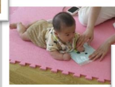
おひさまサークル