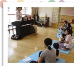
夏の音楽を感じよう