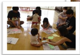
パパと一緒タイム