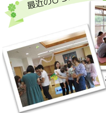
おひさまサークル