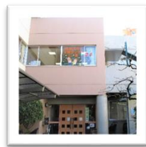
センターは2階です。

社会福祉法人二葉保育園 二葉乳児院併設 地域子育て支援センター二葉 〒160-0012 東京都新宿区南元町4 TEL 03-5363-2170 FAX 03-3359-4596 HP http://www.futaba-yuka.or.jp/int_nyu/hutaba/