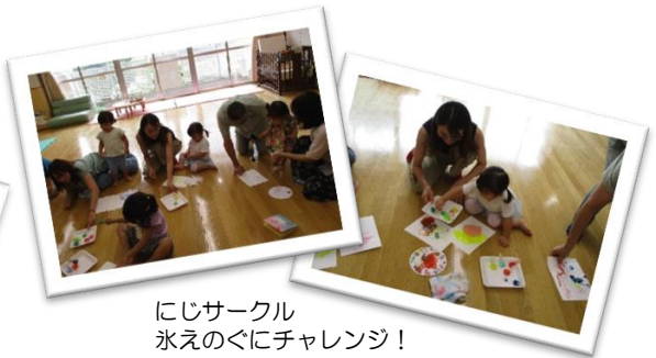
にじサークル 氷えのぐにチャレンジ！ 変わった描き心地にみんな 興味津々でした。