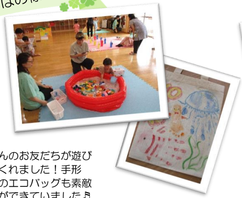
夏祭り たくさんのお友だちが遊び に来てくれました！手形 アートのエコバッグも素敵 な作品ができていました♪